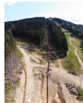
Celkový pohled na areál Špičák II