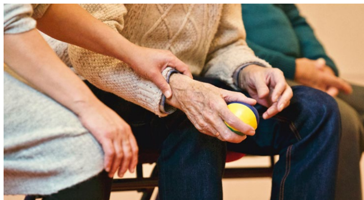
Sociální služby pomáhají lidem v různých životních situacích

Základní činnosti: pomoc při zvládnutí běžných úkonů péče o vlastní osobu, pomoc při osobní hygieně, pomoc při zajištění stravy, pomoc při zajištění chodu domácnosti, výchovné, vzdělávací a aktivizační činnosti,