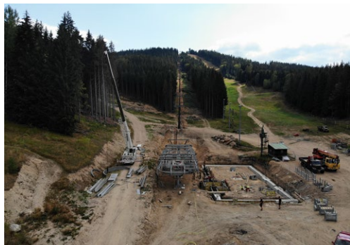
Nová čtyřsedačková lanovka zvýší komfort lyžařů