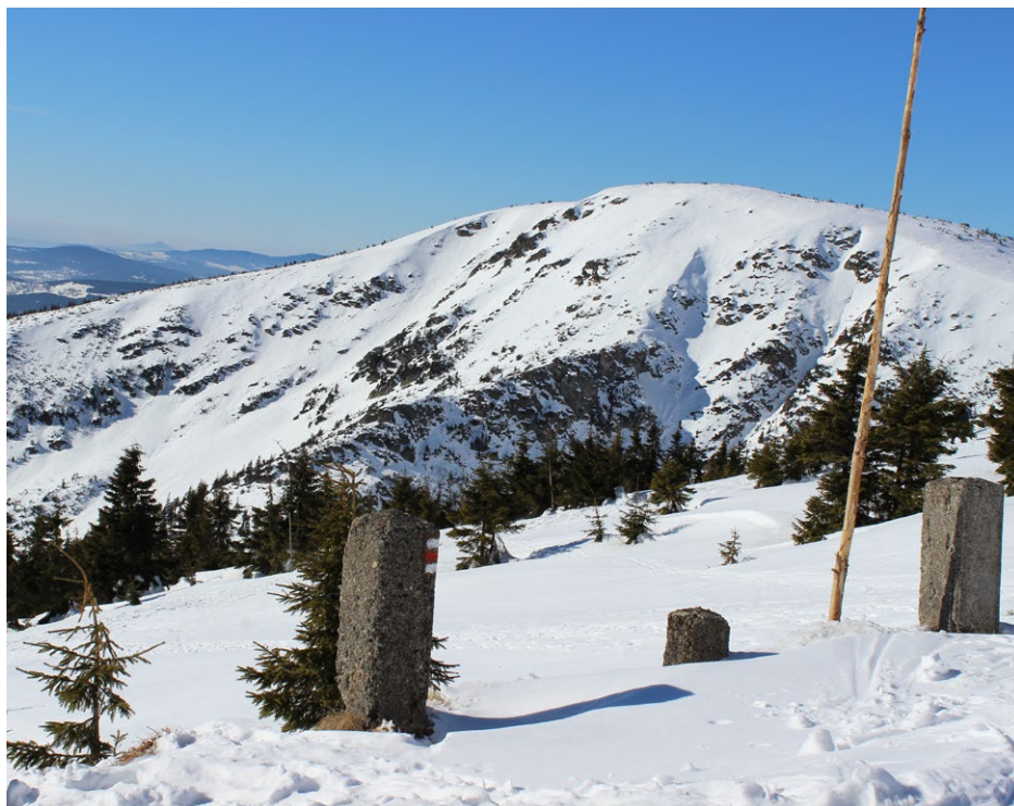
Zimní túry po krkonošských hřebenech potěší turisty krásnými výhledy