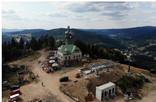
Výstavba horní stanice na vrcholu Tanvaldského Špičáku